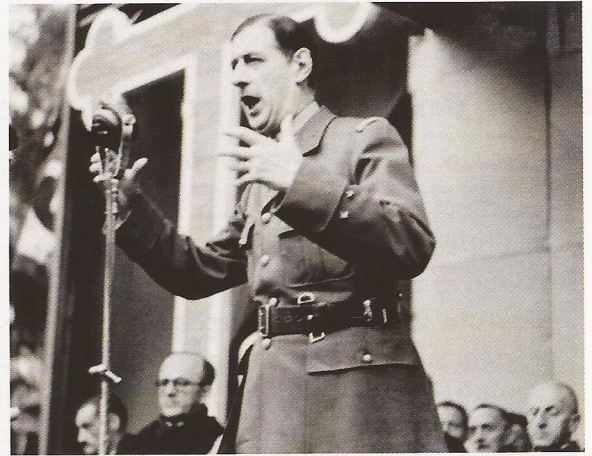
7 Le général Charles de Gaulle le 11 novembre 1943.