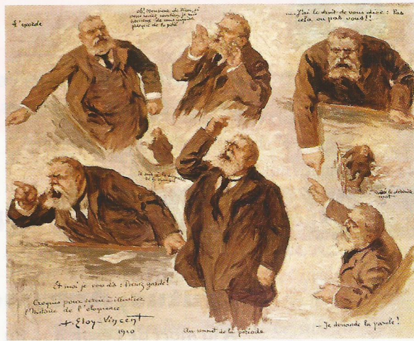
4 Eloy-Vincent, Croquis pour servir à illustrer l'histoire de l'éloquence , 1910, Musée Jean Jaurès, Castres.

5 Jaurès va et vient sur la scène. [...] Il varie peu ses gestes courts, mais bien chargés de vie. Les bras se relayent. Une main se repose dans la poche ou derrière le dos. L'autre, d'un doigt, désigne le sol (Jaurès explique alors, affirme, et met en demeure), ou, du doigt, elle frappe à petits coups horizontaux, elle ne se lasse pas de frapper, au front, les milliers de têtes. Quelquefois, pour achever une période, les deux bras se lèvent ensemble et s'agitent, éperdus.