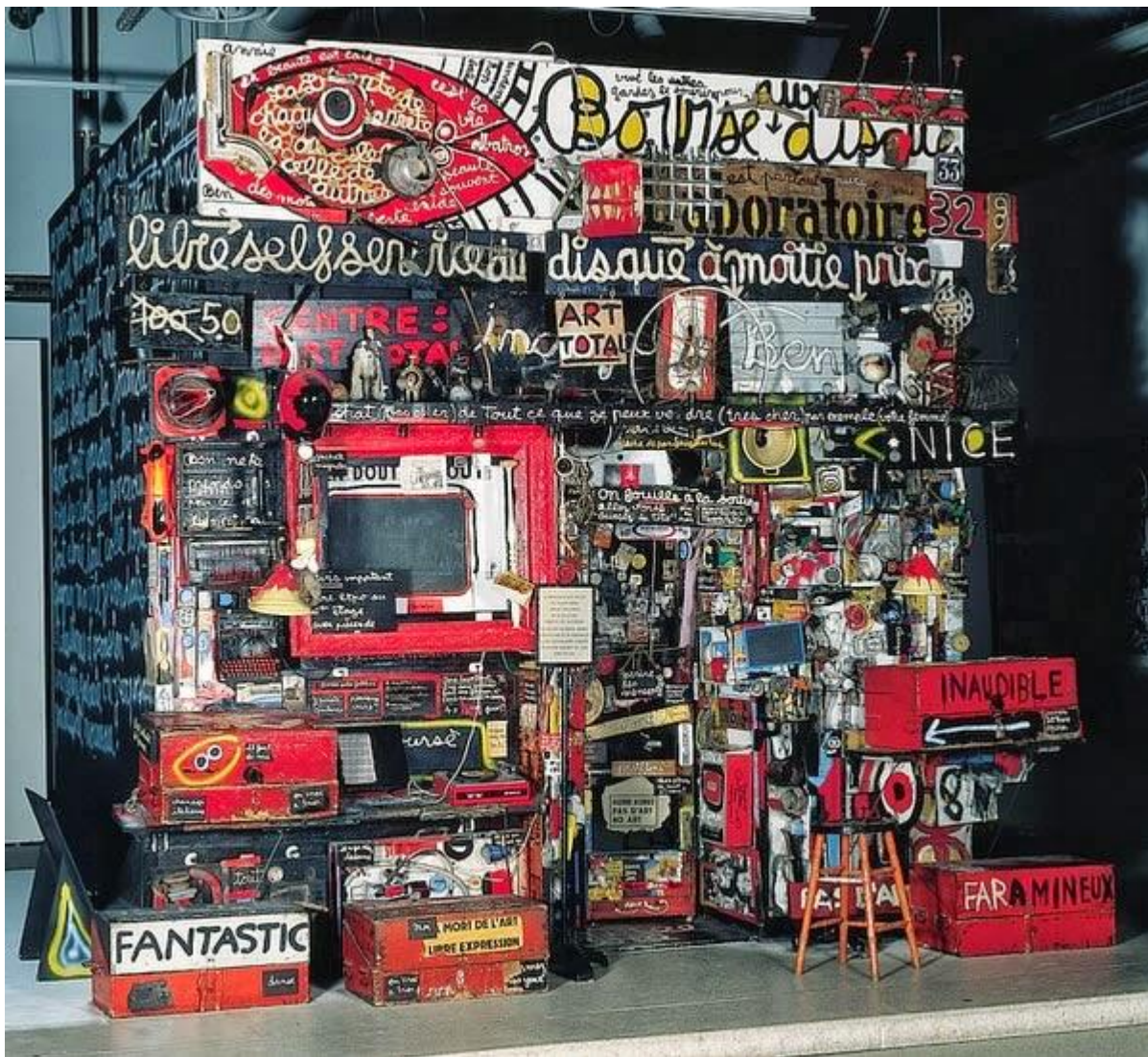
Le Magasin de Ben, Ben , matériaux divers, 3,5 x 5 x 3,5 m, 1958-1973. Centre Georges Pompidou, Paris.