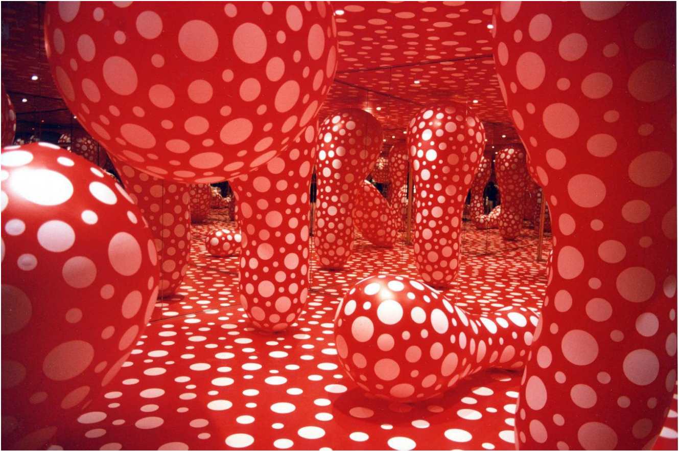
Dots Obsession, Infinity mirrored Room, Yoyoi Kusama, 1998. Installation. Les Abattoirs, Toulouse.

Pour ce travail, il te faut : une feuille de dessin, règle, crayon de papier