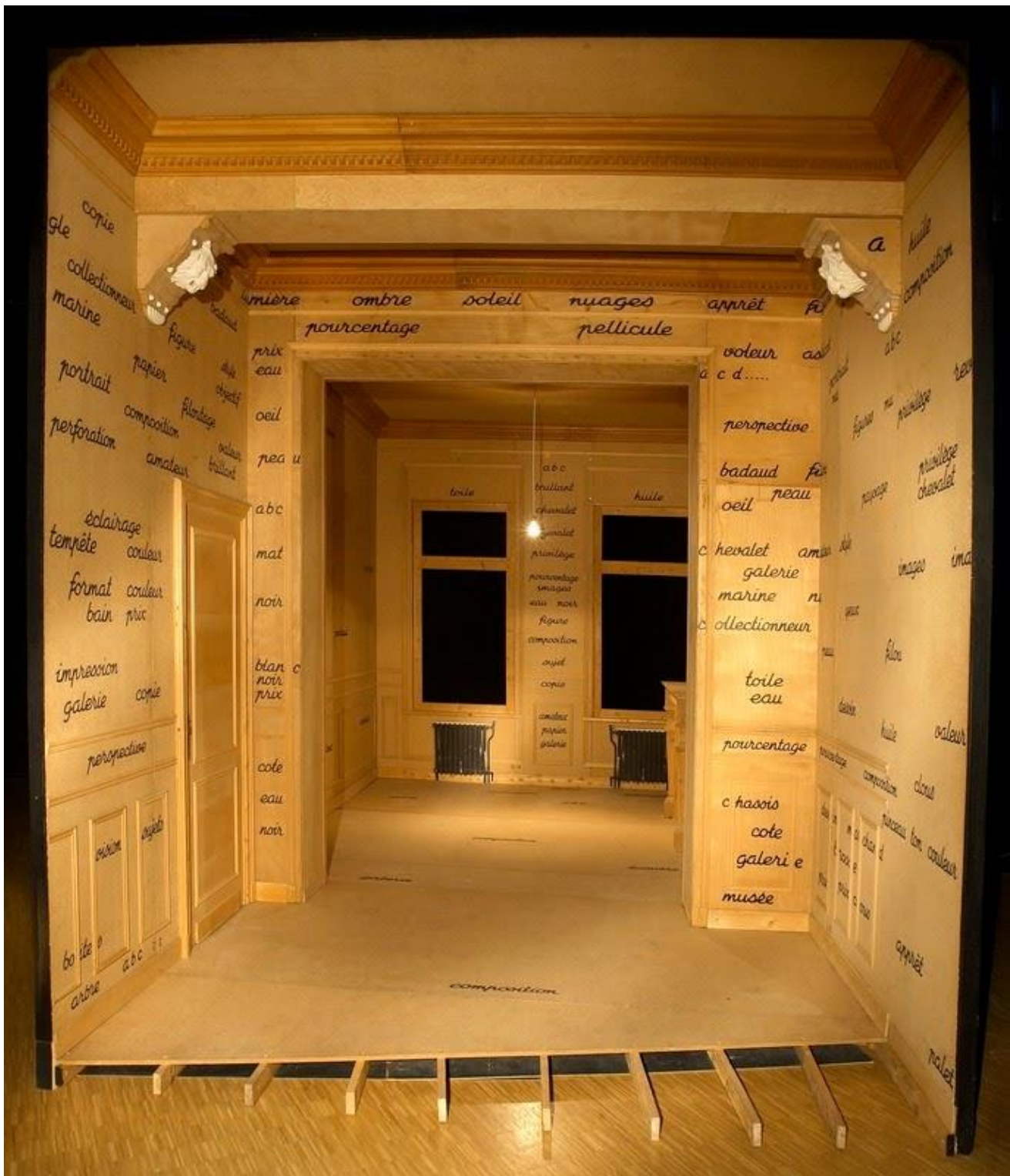
Salle Blanche, Marcel Broodthaers , 1975, bois, photographie, ampoule et inscriptions, 4 x 4.5 x 6 m. Centre Georges Pompidou, Paris.