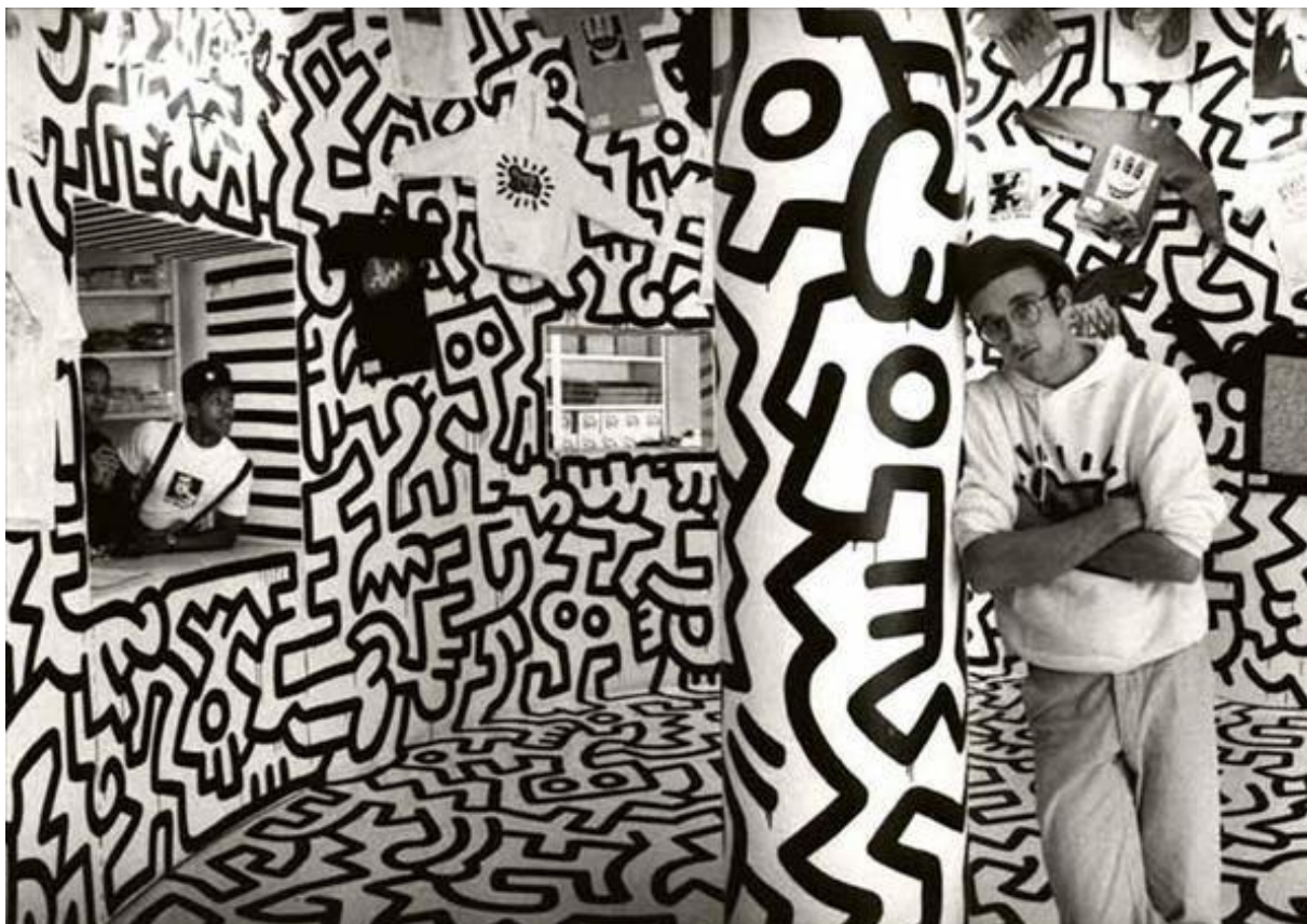
Pop Shop de Keith Haring