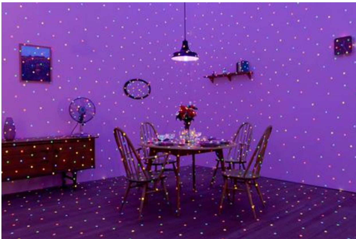
I'm Here, But Nothing , Yayoi Kusama , 2000