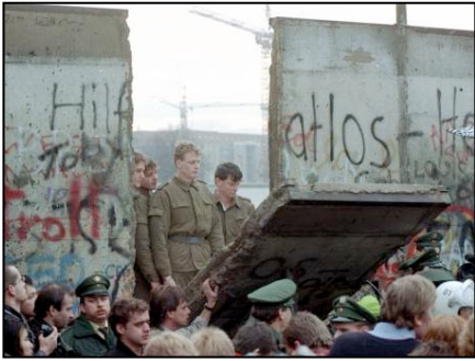
Berlin-est ( RDA ) , novembre 1989