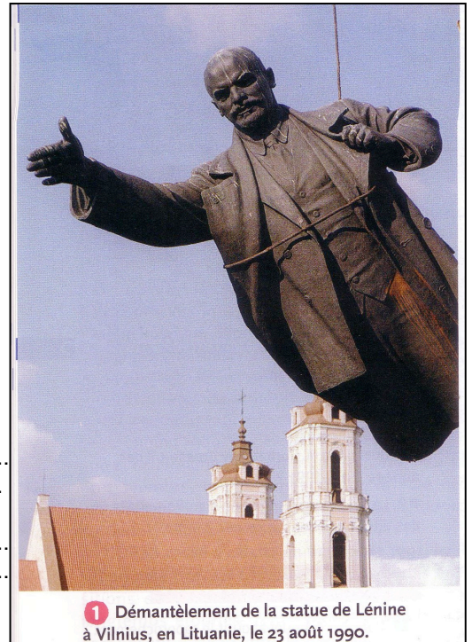
1 Démantèlement de la statue de Lénine à Vilnius, en Lituanie, le 23 août 1990.