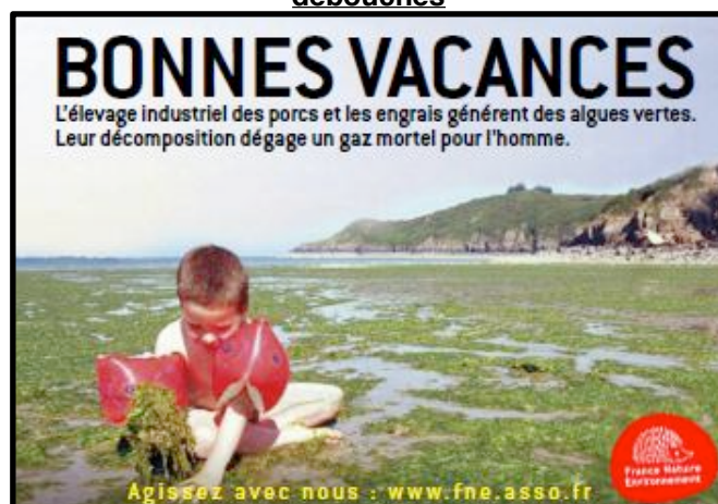
DOC 3 : Une agriculture polluante

Lien : http://www.youtube.com/watch?v=c_GoAkkPUuw