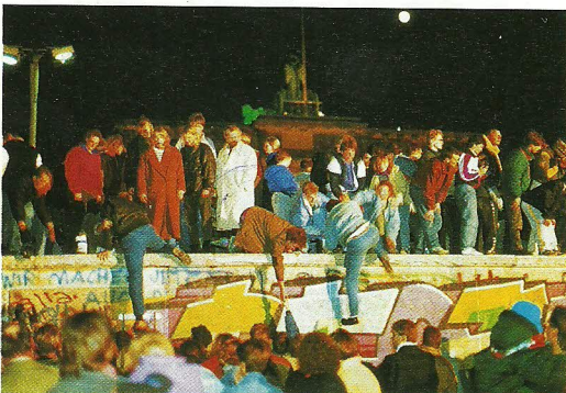
9. November 1989: Öffnung der Berliner Mauer