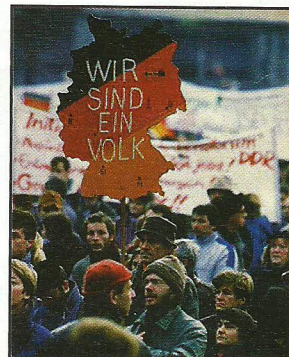
3. Oktober 1990: Vereinigung Deutschlands