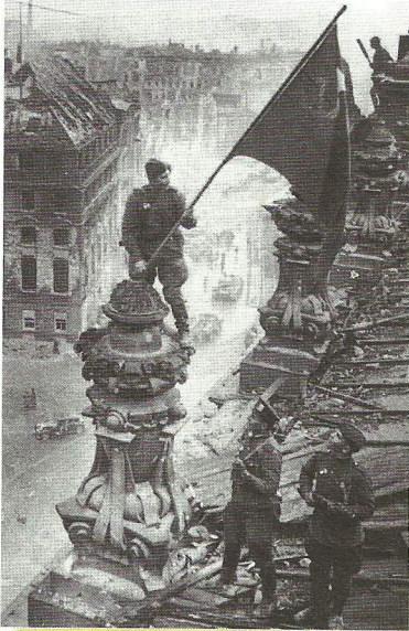
1945: das zerstörte Berlin (deutsche Hauptstadt 1871–1945)