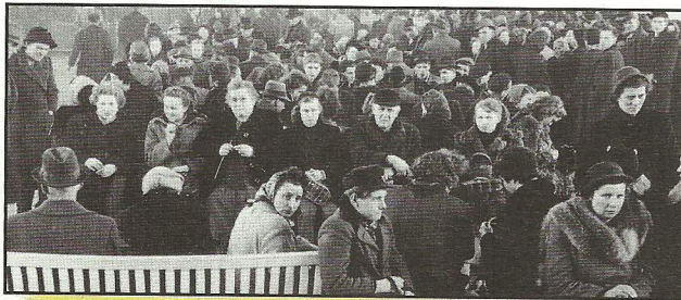
1949–1961: Aufnahme von 2,7 Millionen DDR-Flüchtlingen

1949: Gründung von 2 Staaten: die Bundesrepublik Deutschland und die Deutsche Demokratische Republik