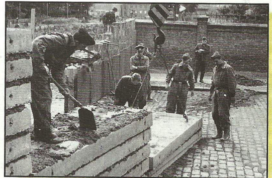
13. August 1961: Bau der Berliner Mauer