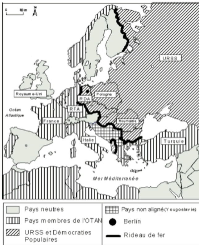
L'Europe en 1949