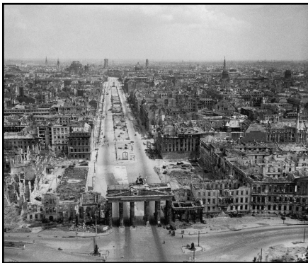
Berlin en 1945