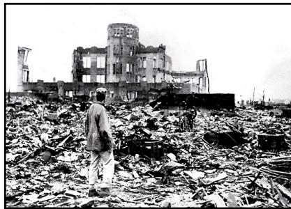
Hiroshima en 1945