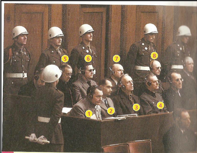
6 Le procès de Nuremberg (1946)

22 dirigeants nazis sont jugés à Nuremberg.