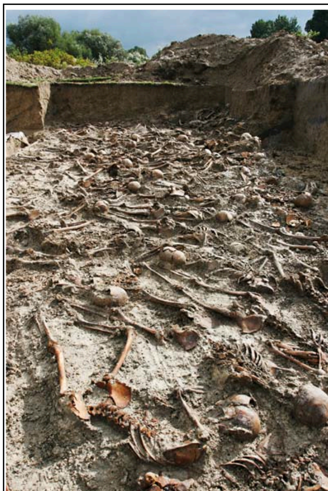
Photographie prise pendant l'expertise archéologique du site de Busk, dans la région de Lvov, où furent localisées 15 fosses communes dans un ancien cimetière juif. Commandée par le Mémorial de la Shoah en 2006 et réalisée sous la responsabilité de Yahad-In Unum, l'expertise a démontré la présence de victimes juives tuées par des balles allemandes entre 1942 et 1943. On peut estimer que cette fosse contient les restes de plus de 150 personnes.